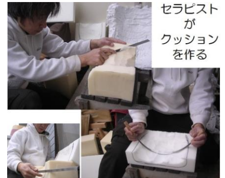
セラピスト が クッション を作る

このようなひとつではない身体状況に対応する、世界中のシーティング・フィッティングを用いた技術を身につけましょう。